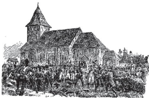
Slaget ved Prestebakke i tegneren A. Blocks strek.

I år er det 200 år siden kulene suste, blankvåpnene skar gjennom kjøtt og blod og mange segnet om på Prestebakke i Enningdalen sør for Halden. Nok en gang var Danmark-Norge og Sverige i krig.